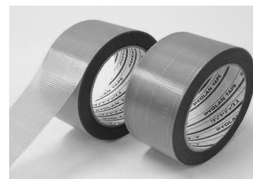
図 1. 養生テープ