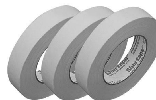
図 2. マスキングテープ